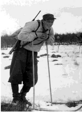
Helge ved Holmsjøen 1944/45 på oppdrag for Grebe Red

Ved mobiliseringen i 1945 trådte Helge fram som troppssjef for Milorg i Sollia. Våren og forsommeren gikk med til vakthold. Avbrutt av arrestasjonsoppdrag av NS-folk i nabobygdene og ettersøk av norske gestapister som søkte tilflukt i Rendalen. -Døm mente døm kanskje hadde rest oppover å Sollia, srru, før døm fainn att bilen døms som døm hadde prøvd å ruille uti Storsjøen.